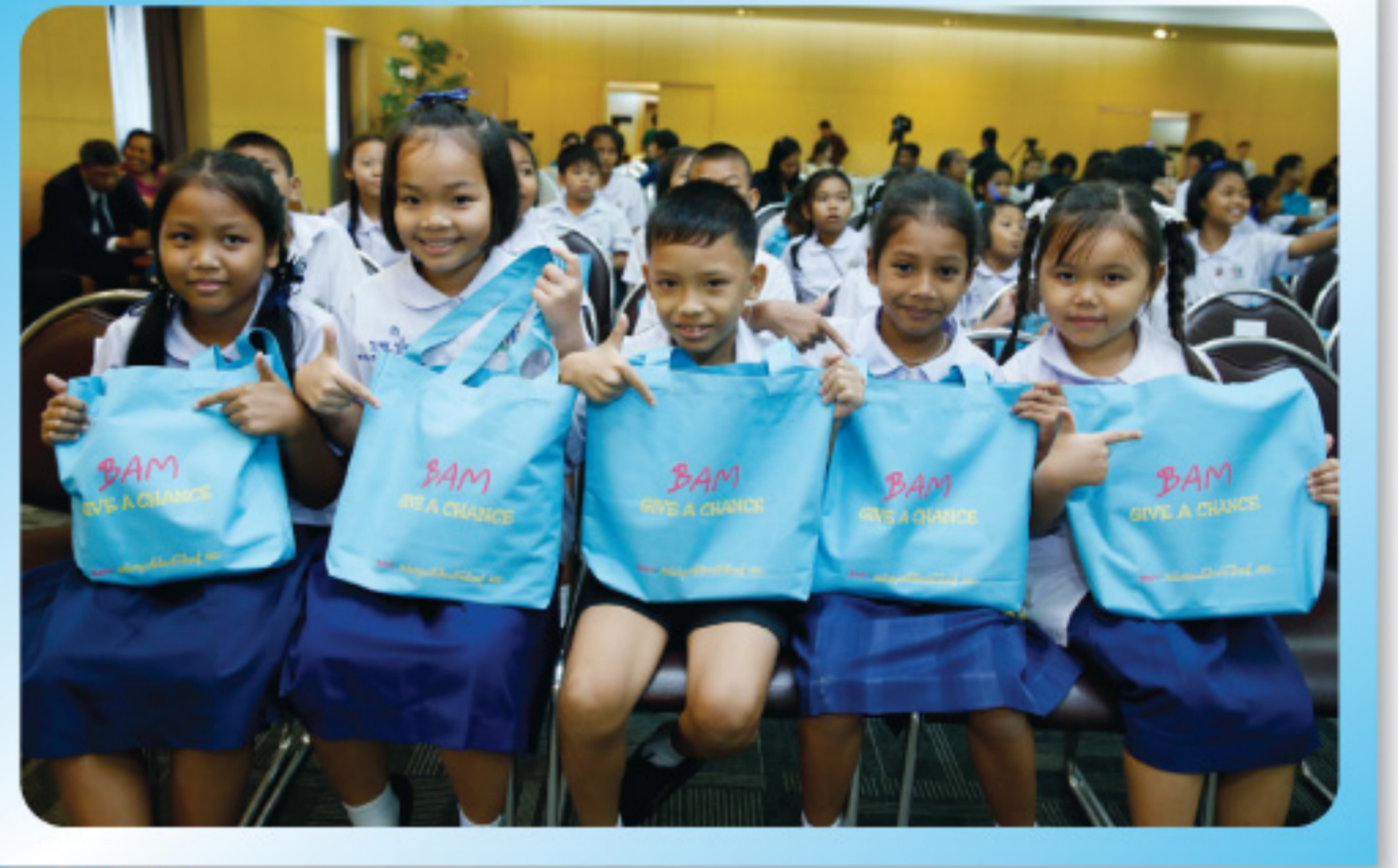
• นักเรียน จากโรงเรียนในสังกัดกรุงเทพมหานคร