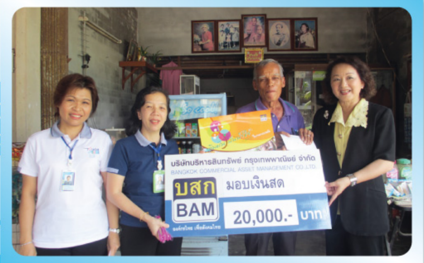
• ช่วยเหลือผู้เดือดร้อน โครงการ “เติมฝัน บันน้ำใจ กับ BAM”

การจัดทำสารคดีสั้นชุด “เติมฝัน บันน้ำใจ กับ BAM” เป็นอีกโครงการหนึ่งที่ BAM ได้มีส่วนช่วยเหลือผู้เดือดร้อนในสังคมให้มีความเป็นอยู่ที่ดีขึ้น และพร้อมที่จะสู้ชีวิตต่อไป รวมทั้งเป็นกำลังใจให้กับบุคคลเหล่านั้นได้มีกำลังใจในการทำมาหากิน และเป็นแบบอย่างที่ดีให้กับสังคมตลอดไป