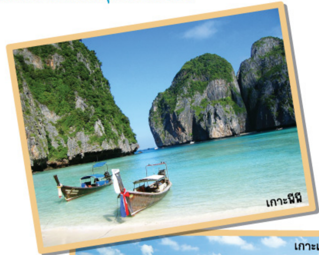
เกาะพีพี

ตั้งอยู่ในพื้นที่อุทยานแห่งชาติหาดนพรัตน์ธารา จังหวัดกระบี่ เป็นหมู่เกาะกลางทะเลอันดามัน ด้วยความงดงามทางธรรมชาติของเกาะพีพีทำให้เคยติดอันดับที่ 1 จาก 10 ของเกาะที่สวยงามที่สุดในโลก จนได้รับสมญานามว่าเป็น “มรกตแห่งอันดามัน” และยังคงถูกใช้เป็นสถานที่ถ่ายทำภาพยนตร์เรื่องเดอะบีชอีกด้วย จึงไม่แปลกที่มีนักท่องเที่ยวจากทั่วทุกมุมโลกเดินทางมาสัมผัสความงามด้วยตาของตัวเอง