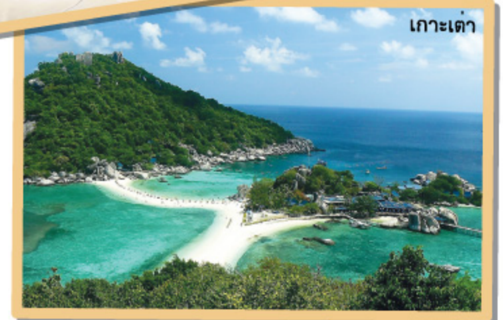
เกาะเต่า

อยู่ในเขตจังหวัดสุราษฎร์ธานี ตั้งอยู่บริเวณอ่าวไทยรูปร่างของเกาะเป็นทรงยาว ๆ คล้ายเมล็ดถั่ว หลายคนคงสงสัยว่าทำไมถึงได้ชื่อว่า “เกาะเต่า” ที่มาของชื่อนี้มาจากมีเต่าจำนวนมากพากันมาวางไข่ที่เกาะแห่งนี้ ซึ่งเป็นอีกเกาะที่ได้รับความนิยมจากนักท่องเที่ยวทั่วโลก จนได้รับฉายาว่า “เกาะสวรรค์กลางอ่าวไทย”