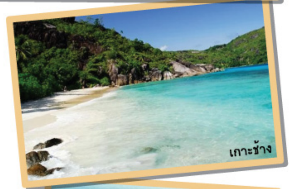
เกาะช้าง

เป็นเกาะที่ใหญ่ที่สุดในอ่าวไทย อยู่ในเขตจังหวัดตราด เป็นภูเขาสูง มีหินผาซับซ้อน มีหาดทรายขาวสะอาด น้ำทะเลใส และมีแหล่งอำนวยความสะดวกครบครัน ทั้งที่พัก ร้านอาหาร ที่สำคัญอยู่ไม่ไกลจากกรุงเทพฯ มากนัก