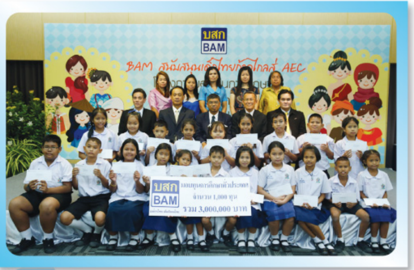
• โครงการมอบทุนการศึกษา

ขณะเดียวกันตั้งแต่ปี 2551 จนถึงปัจจุบัน บริษัทฯ ยังได้จัดทำสารคดีสั้น “เติมฝัน บันน้ำใจ กับ BAM” เพื่อร่วมระดมหัวใจคนไทยช่วยเหลือผู้เดือดร้อนในสังคม ซึ่งในปี 2557 ได้ดำเนินโครงการดังกล่าวต่อเนื่องเป็นปีที่ 7 แล้ว โดยออกอากาศในช่วงเวลาของรายการบางอ้อ สถานีโทรทัศน์โมเดิร์นไนน์ ทุกวันเสาร์ ช่วงเวลา 13.30-14.00 น. นำเสนอเรื่องราวชีวิตของผู้เดือดร้อนในสังคมมาถ่ายทอด พร้อมนำเสนอภาพความช่วยเหลือที่ถูกส่งมอบไปยังผู้เดือดร้อน